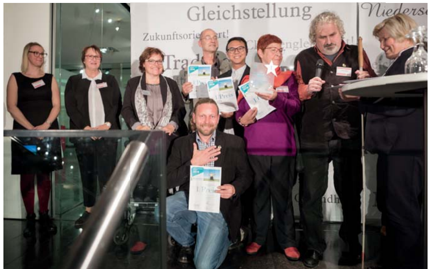
Den SoVD-Inklusionspreis in der Kategorie Ehrenamt gewann das Team vom Verein Fährmannsfest in Hannover.