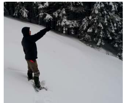
Am Meer oder im Schnee – ein Tapetenwechsel kann Jugendlichen mit Problemen helfen.

die die Sirius erfüllt. Für die Reiseprojekte im Inland gab es das Siegel des Bundesverbands. Für den Auslandsbereich wird die Zertifizierung beim Jugendhilfetag 2017 vorgestellt.