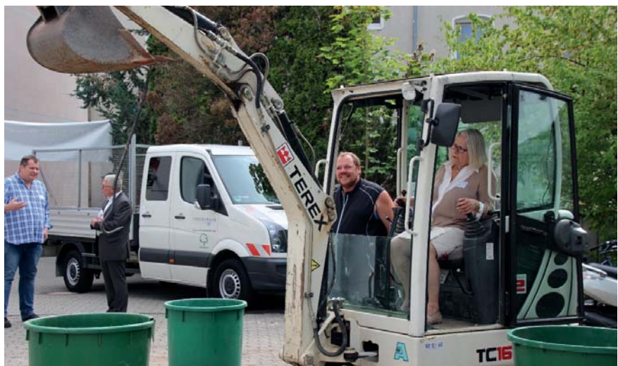
Offizielle Reden, aber auch ein buntes Fest mit zahlreichen Mitmachaktionen – so feierte der Industrie-Service der Lebenshilfe Braunschweig sein 25-jähriges Bestehen.

Nein, man muss nicht die ganze Historie erzählen. Aber dass der Industrie-Service vor 25 Jahren eine der ersten Werkstätten für Menschen mit seelischen oder psychischen Beeinträchtigungen in Niedersachsen wurde, das schon. Denn es zeigt, und dafür gab es auch viel Lob in einem Grußwort der Stadt Braunschweig anlässlich der Jubiläumsfeier am 09.09.2016, wie unentwegt die Lebenshilfe Braunschweig gemeinnützige GmbH nach neuen Ansätzen sucht, um Menschen mit Beeinträchtigung ein für sie passendes Umfeld, vor allem aber Perspektiven zu eröffnen.