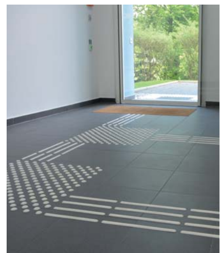
Bodenindikatoren im Eingangsflur eines Hauses als Beispiel für Barrierefreiheit in Gebäuden.

merinnen und Teilnehmer werden dadurch in die Lage versetzt, sicher und