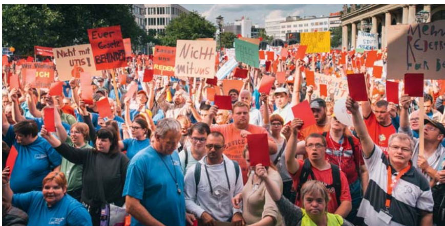
So nicht! Für echte Teilhabe ohne Hürden! Unter diesem Motto demonstrierten am 22.09.2016 rund 7000 Menschen mit und ohne Behinderung auf dem Opernplatz in Hannover für ein besseres Bundesteilhabegesetz.

Dieser Protest war nicht zu übersehen und nicht zu überhören: Auf dem Opernplatz in Hannover haben am 22.09.2016 rund 7000 Menschen, davon die meisten mit Behinderung, für ein besseres Bundesteilhabegesetz demonstriert. Der Paritätische Wohlfahrtsverband Niedersachsen e.V. und seine Mitgliedsorganisationen Blinden- und Sehbehindertenverband Niedersachsen e.V., Lebenshilfe Landesverband Niedersachsen e.V. und SoVD Landesverband Niedersachsen e.V. hatten gemeinsam mit anderen Organisationen aus der Behindertenhilfe und -selbsthilfe zu der Kundgebung aufgerufen, zu der viel mehr Menschen kamen als im Vorfeld erwartet.