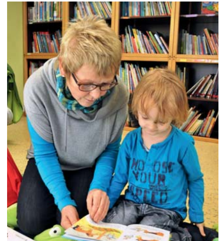
Die Zeit muss sein: Vorlesen fördert das Sprachverständnis.

Seit August gilt die überarbeitete Landesrichtlinie mit erweiterten Aufgaben. Das Kultusministerium stellt für den Zeitraum bis Juli 2019 weiteres Geld für die Regionalkonzepte zur Verfügung. Der Paritätische Braunschweig baut damit sein Angebot aus, im Landkreis Gifhorn wird noch mehr möglich: Weiterqualifizierung aller pädagogischen Fachkräfte, Beratung und Coaching in den Einrichtungen, themenbezogene Dienst- und Fallbesprechungen, die Beobachtung einzelner Kinder im Gruppengeschehen mit anschließender Reflexion, konkrete Anregungen zu