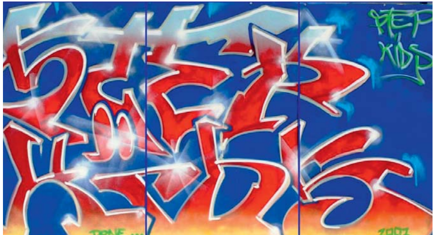
„STEP Kids“: Die Suchthilfe-Organisation hat ihr Spektrum erweitert.

Junge Menschen mit Suchtproblematik haben oft mit mehreren Problemlagen gleichzeitig zu tun. Sie zeigen schon im Kindesalter soziale und psychische Auffälligkeiten, andere haben