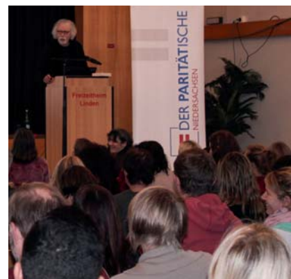
Großes Interesse: Der Fachtag in Hannover war gut besucht.

Ausbildung und Ausbildungsförderung kam es bereits in der Mittagspause zum munteren Austausch unter den TeilnehmerInnen. Schnell war klar: Die Erfahrungen der TeilnehmerInnen sind sehr verschieden, von Landkreis zu Landkreis unterscheiden sich die Vernetzung der Bildungseinrichtungen und anderer Akteure. Einhellige Meinung herrschte darüber, dass es flächendeckend zu wenige Angebote wie SPRINT-Klassen und Integrationskurse gibt. Trauriger Konsens auch, dass Heranwachsende, die nicht mehr der Schulpflicht unterliegen, aufgrund dieses Mangels oft hinten runterfallen. Sie bekommen einfach keine Plätze in den zu wenigen Kursen. Dass die Politik die Behörden zur Unterscheidung zwischen Flüchtlingen mit guter und solche mit schlechter Bleibeperspektive nötigt, macht die Situation nicht besser. Das führt dann zum Beispiel dazu, dass ein junger Afghane 14 Monate lang im Asylverfahren steckt und keine Sprach- oder Integrationskurse besuchen darf. Am Ende bekommt er vielleicht doch Asyl – hat aber deutlich schlechtere Chancen in Schule und Arbeitsmarkt als gleich alte andere Flüchtlinge. Das befördert Langzeitarbeitslosigkeit, für den Staat teuer, für den Einzelnen prekär.