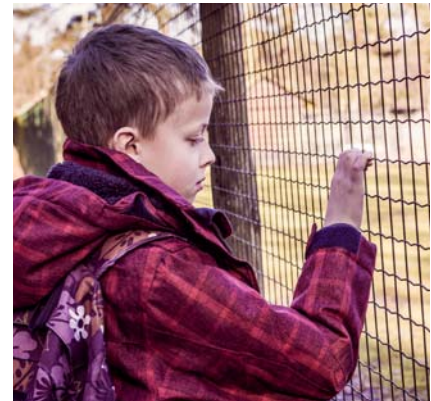
„Die 2. Chance“: Schuleschwänzen ist oft ein Symptom für andere Probleme.