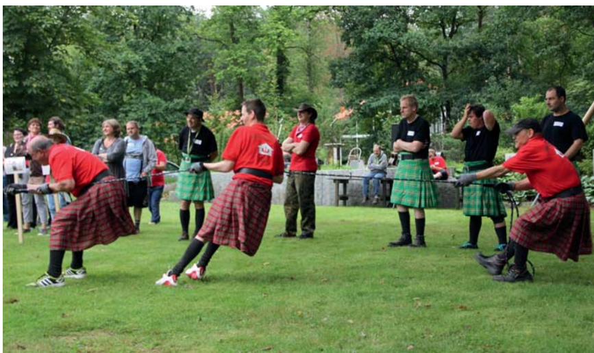
Sie gaben alles: „Albert's Baumschubser 2.0“ beim „Tug-o-War“ genannten Tauziehen.

Etwas ungewöhnlich, aber mit unglaublich viel Elan und Lebensfreude hat die Behindertenhilfeeinrichtung der paritätischen Mitgliedsorganisation Albert-Schweitzer-Familienwerk e.V. in Hermannsburg im August ihr 30-jähriges Bestehen begangen: 30 Tage lang feierten BewohnerInnen, Angehörige, Nachbarn und Mitarbeitende den Kultursommer. Höhepunkt der Feierlichkeiten waren die „Albert-Spiele“ mit 60 TeilnehmerInnen aus mehreren Einrichtungen der Behindertenhilfe. Denn was könnte es Besseres geben als eine große Zahl unterschiedlichster, bewegungsbegeisterter Menschen, fünf ausgefallene, sportliche Disziplinen und ein großer Haufen Sportfreunde zum Anfeuern? Und so sorgten ein kunterbuntes Rahmenprogramm, spannende Wettkämpfe und ein beinahe wolkenloser Himmel am Wochenende, 13./14.08.2016, auf dem Gelände der Albert-Schweitzer-Behindertenhilfe Hermannsburg für reges Treiben. Der Einladung zu den „Albert-Spielen“ waren unzählige Menschen gefolgt – groß, klein, mit und ohne Handicap.