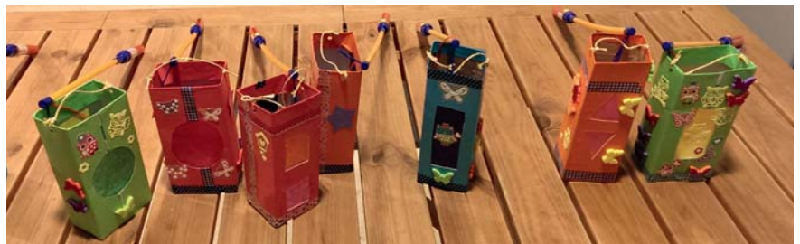
„Opstapje“: Basteln, Spielen, Vorlesen – Zielgruppe des Projekts sind Kinder aus Familien mit sozial schwierigen Verhältnissen.

Im Fokus stehen neben der altersgerechten Entwicklung der Kinder und der Eltern-Kind-Bindung auch die individuellen Lebensumstände. Viele Familien müssen schwierige Lebenslagen bewältigen. Das Team von Opstapje ist in der Region sehr gut vernetzt und kann Unterstützung durch die Vermittlung an andere Institutionen leisten. Die aufsuchende Struktur der Hausbesuche erreicht verstärkt auch diejenigen Familien, die eine Hemmschwelle gegenüber öffentlichen Einrichtungen haben oder sich nicht alleine zu Spielkreisen trauen. Die GBA hat sich aufgrund der aktuellen gesellschaftlichen Entwicklungen auch dem Flüchtlingsthema zugewandt und das Programm für Familien mit Fluchterfahrung geöffnet. Opstapje leistet durch seine niedrigschwellige Struktur einen wertvollen Beitrag zur Integration von Flüchtlingsfamilien.