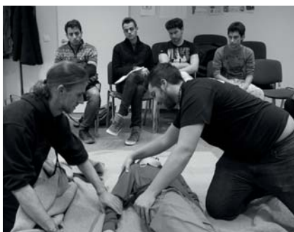
Geflüchtete und einheimische Jugendliche unternehmen viel zusammen – und absolvieren schon mal einen Erste-Hilfe-Kursus.