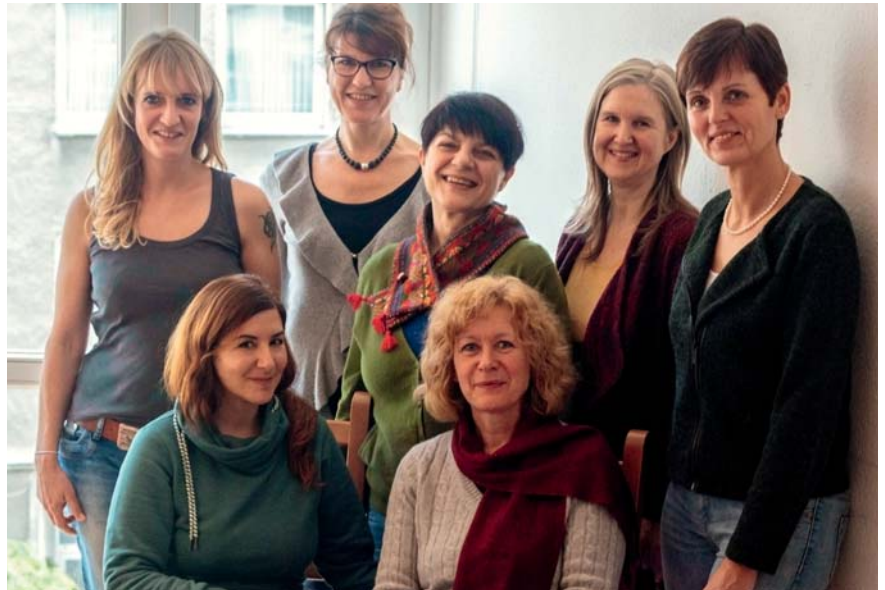
Das Team von INUIT e.V. betreut Kinder und deren Eltern – aber eines ist klar: Das Kindeswohl steht an erster Stelle.

Die Arbeit von INUIT umfasst Begleitung zu Behörden und Ärzten, Beratung bei Paarproblemen, Erziehungs- und Entwicklungsfragen und Ermutigung im Fall von Zweifeln oder Schuldgefühlen. Dabei wird stets auf die Schaffung eines sicheren und entwicklungsfördernden Rahmens für die Kinder geachtet. Der Arbeit liegt der Ansatz der Systemischen Therapie zugrunde, was vor allem Ressour-