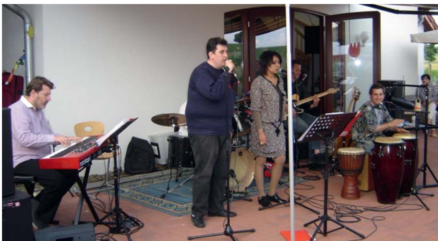
Auftritt der Gruppe „Cachou-Cachou“ in Gillersheim.

Im Juni 2016 fand ein inklusives Kooperationsprojekt mehrerer paritätischer Mitgliedsorganisationen in Südniedersachsen statt. Zunächst hatte der Verein Treffpunkt e.V. aus Gillersheim seinen bereits im Jahr 2000 geknüpften Kontakt zu einer Werkstatt für behinderte Menschen im Elsass im August 2015 wieder aufgefrischt. In Kooperation mit dem Bildungswerk ver.di fand daraufhin ein Bildungsurlaub für Menschen mit Beeinträchtigungen in Sélestat statt. Bei diesem