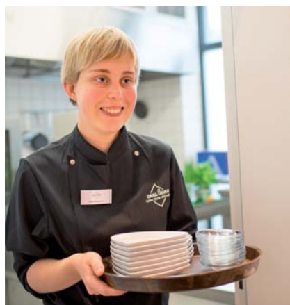
Stets motiviert: Mitarbeiterin im „anna leine“.

In dem beliebten Kaffeehaus „anna leine“ im Gebäude der Volkshochschule am Hohen Ufer in Hannover arbeiten Menschen mit und ohne Behinderungen erfolgreich zusammen. Vor etwas über einem Jahr, am 01.10.2015, ist das jüngste Inklusionsprojekt der paritätischen Mitgliedsorganisation Hannoversche Werkstätten gGmbH an den Start gegangen – Zeit also für ein erstes Fazit.