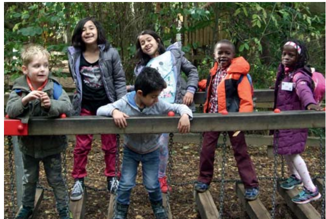
Highlight der Ferienfreizeit: Der Tagesausflug in den Dinosaurierpark.

Die 25 Kinder im Alter von sieben Monaten alten Zwillingen bis zu 15-Jährigen knüpften Kontakte und genossen die gemeinsame Zeit. Highlight war der Tagesausflug in den Dinosaurierpark. Aber auch das Stock-