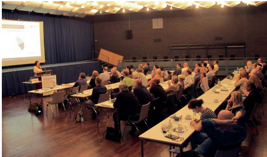
Referentinnen und Referenten der Wohnungslosenhilfe, Kommune, Wohnungswirtschaft sowie ein lokales Bündnis zur Generierung von Wohnraum stellten ihre Konzepte und Ideen einem breiten Interessentenkreis vor.