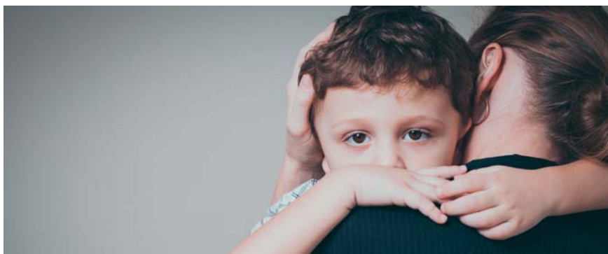
Wenn sonst keiner helfen kann, kommt die Kinder- und Jugendhilfe ins Spiel.

Die Gesetze von damals wie heute nehmen alle beteiligten Akteure in die Pflicht. Selbsthilfe seitens Kindern, Jugendlichen und Eltern hat Vorrang, die freie Wohlfahrt unterstützt die