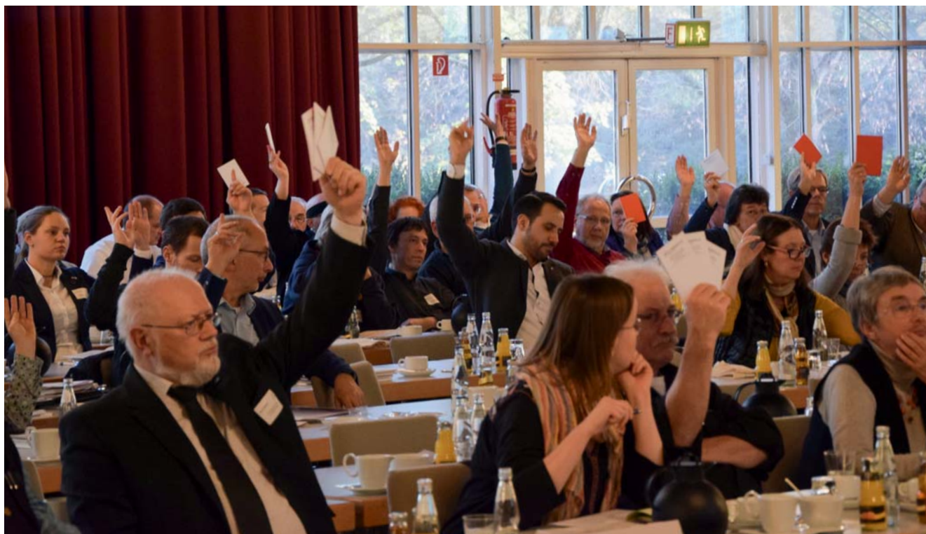
Deutliches Votum: Die Mitgliederversammlung als höchstes Gremium des Verbands verabschiedet die Resolution einstimmig.

Die Rahmenbedingungen für Teilhabe in der frühkindlichen und der schulischen Bildung gehen in die richtige Richtung, aber die Ausstattung mit Geld und Personal ist völlig unzureichend. Der erste Arbeitsmarkt nimmt nach wie vor viel zu wenige Menschen mit Behinderung auf, und