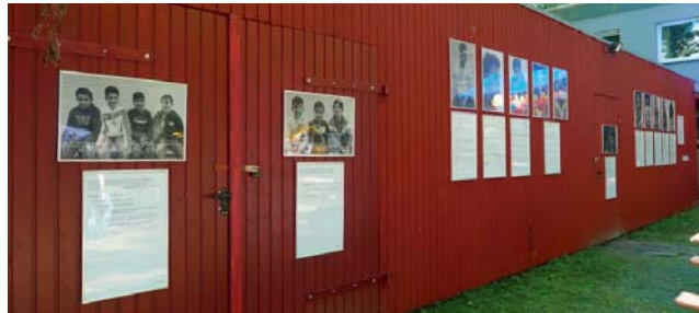
Ein Fotograf hat junge Geflüchtete fotografiert, die das Jugendzentrum in Bad Bederkesa besuchen. Daraus ist eine eindrucksvolle Wanderausstellung entstanden.

Die Grundidee: Junge Geflüchtete zu integrieren gelingt nur, wenn diese einen Ort haben, wo sie Gleichaltrige treffen und zu ihnen Kontakt aufbauen können. Genau da knüpfen die jungen ehrenamtlichen Menschen im Rahmen der Jugendarbeit an. Sie wirken dem verbreiteten Problem entgegen, dass die jungen Geflüchteten keinen Anschluss an Einheimische finden, dass sie keine Antworten auf ihre Fragen bekommen. Dies hat das Projekt immer wieder gezeigt: Als „Neuer“ in der Stadt, in der Gemeinde fehlt es an Orientierung, es fehlen Gleichgesinnte mit gemeinsamen Interessen, und es fehlt der Austausch über jugend-